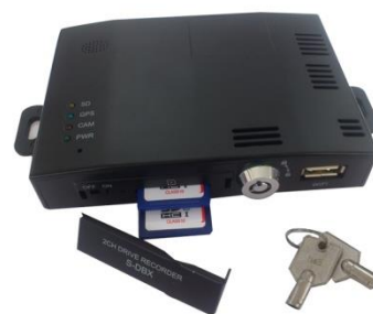
SD Lock Cover open